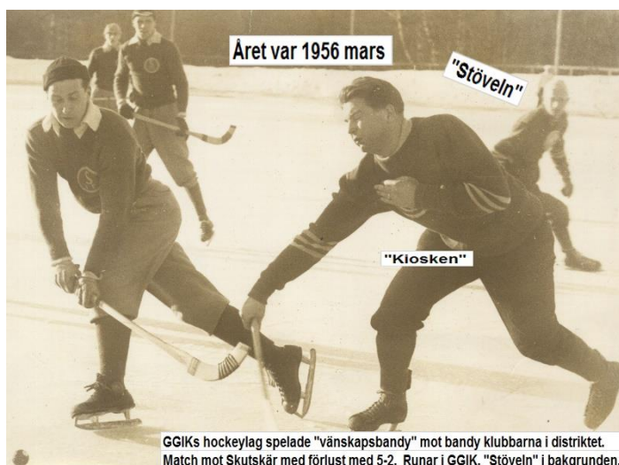
Året var 1956 mars