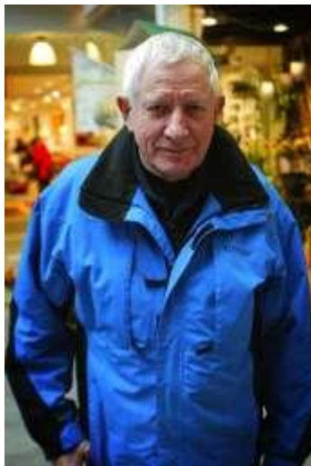
Fotograf: Nick Black mon