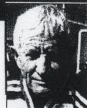
Hans "Stöveln" Öberg.

En av Sveriges genom tiderna bästa ishockeyspelare har gått ur tiden. Vi har haft kontakt sedan 1948 och spelat ishockey tillsammans i tio år. Även efter vår aktiva tid höll vi kontakten. Jag har haft förmånen att vara hans ledsagare och presentatör vid hundratals framträdanden från Folkets hus i Ljusdal under 1950-talet till vårt sista framträdande på en av Sandvikens AIK:s lunchträffar för något år sedan.