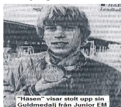
"Häsen" visar stolt upp sin Guldmedalj från Junior EM

lagkamraterna i Team 63 men var en bland de tongivande i laget med sin energi. "Häsen" spelade pojk och juniorhockey i moderklubben GGIK genom åren och blev därmed inte uttagen att spela i Junior-VM eftersom man tog ut enbart elitspelare även om han gladligen skulle platsa. Däremot var han med och tog EM-guld 1982.