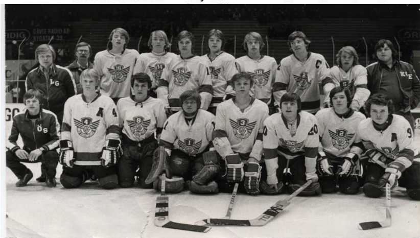
GGIK Team 62-63 Säsongen 1978-79