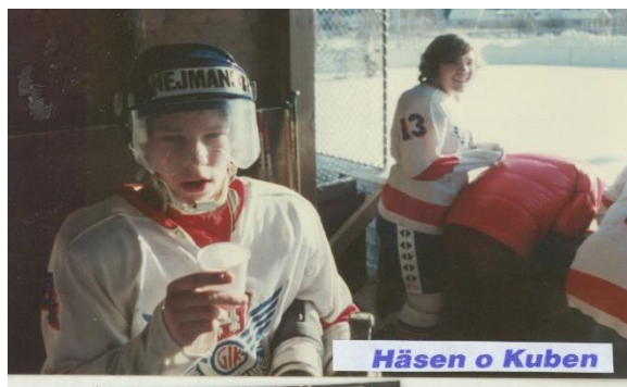
Häsen o Kuben

Född: 1964-12-19 i Gävle Moderklubb: Gävle GIK Klubba: Vänster Pos: C Forward