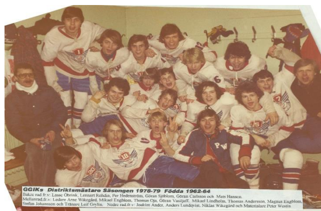
GGIKs Distriktsmästare Säsongen 1978-79 Födda 1962-64