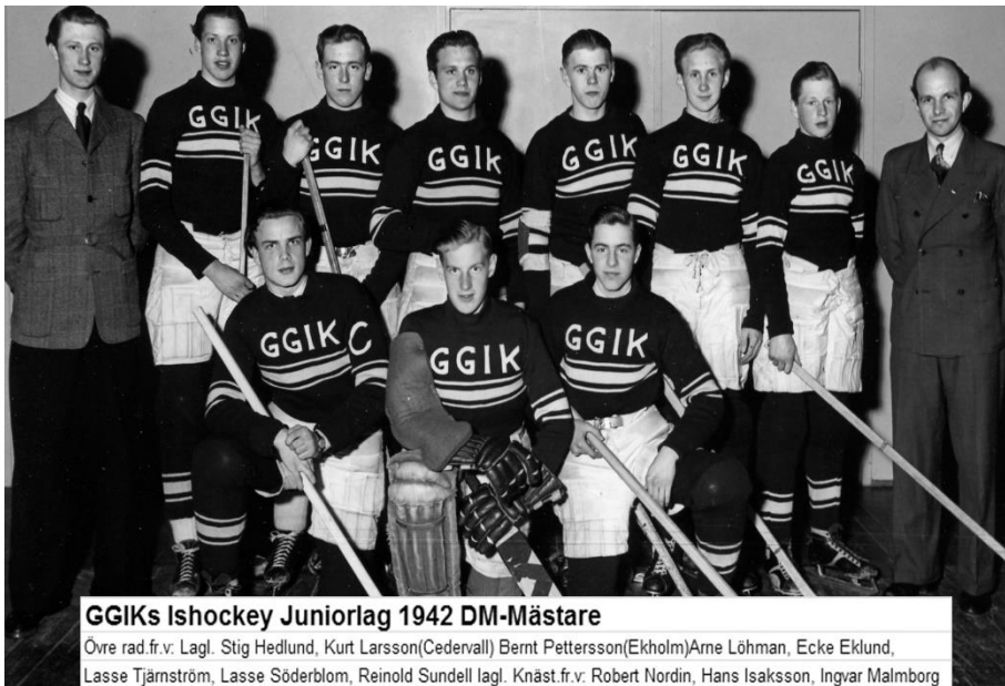
GGIKs Ishockey Juniorlag 1942 DM-Mästare