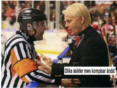
Olika åsikter men kompisar ändå!

men provat på att stå mål under pojktiden. "Kuben" var lite "busig" i sitt spelsätt. Och visst ligger de något i att de största busarna blir de bästa domarna. Finns flera exempel på det. "Buse" är väl lite att ta i. Genom att "Kuben" gått domarkursen och då blev det lite snack med domarna. Många