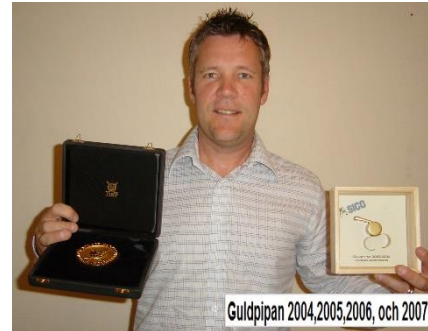
Guldpipan 2004, 2005, 2006, och 2007