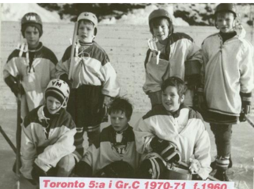
Toronto 5a i Gr.C 1970-71 f.1960

Så gjorde "Kuben" sista matchen den 27 mars 2015 bara 53 år gammal och 26 år lång domarkarriär bakom sig. I dagsläget svarar "Kuben" som expert på domarfrågor i tv-kanalen C-more och åsikter lär inte saknas. Red. önskar lycka till med nya uppdraget, men vi saknar domare nummer 10 på ryggen. 20160424 C/L